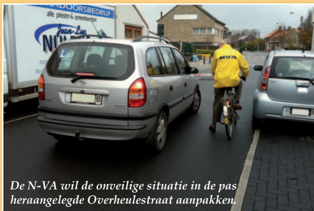
De N-VA wil de onveilige situatie in de pas heraangelegde Overheulestraat aanpakken.

We sluiten af met een tip van de N-VA voor het bestuur. Misschien kunnen jullie in de toekomst toch ook eens rekening houden met de mening van de Moorseleenaar. Dit zou in elk geval helpen om de wegeniswerken niet opnieuw te laten ontaarden in ergeniswerken.