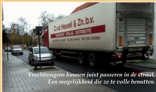
Vrachtwagens kunnen juist passeren in de straat. Een mogelijkheid die ze te volle benutten.

N-VA Wevelgem heeft daarom twee essentiële speerpunten: