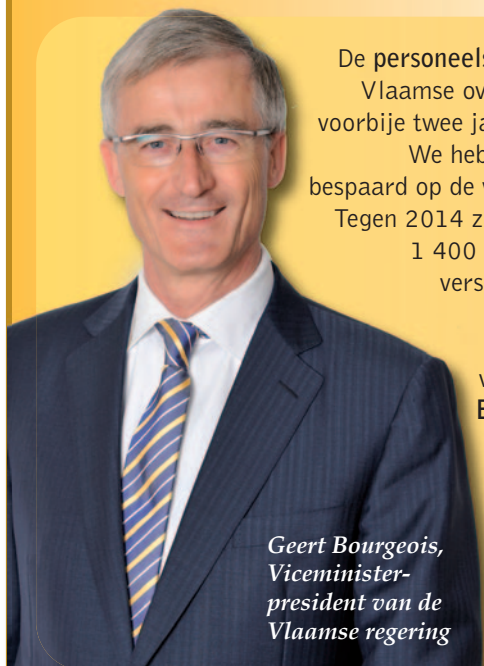
Geert Bourgeois, Viceminister- president van de Vlaamse regering

De personeelsbudgetten van de Vlaamse overheid daalden de voorbije twee jaar met 5 procent. We hebben ook drastisch bespaard op de werkingsmiddelen. Tegen 2014 zullen er bovendien 1 400 ambtenaren op de verschillende Vlaamse departementen niet stelselmatig vervangen worden. Een besparing van 50 miljoen euro per jaar!