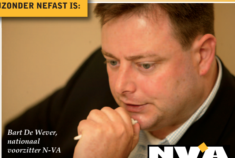
Bart De Wever, nationaal voorzitter N-VA