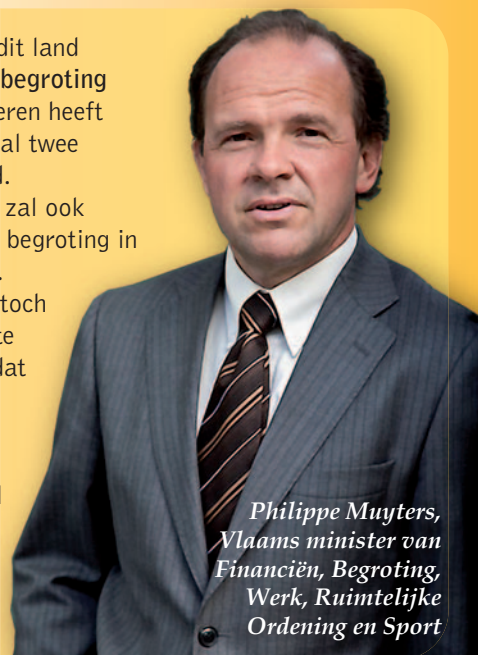
Philippe Muylers, Vlaams minister van Financiën, Begroting, Werk, Ruimtelijke Ordening en Sport

Als enige overheid in dit land heeft Vlaanderen een begroting in evenwicht. Vlaanderen heeft de voorbije twee jaar al twee miljard euro bespaard. De Vlaamse Regering zal ook de volgende jaren een begroting in evenwicht voorleggen. Als er geleidelijk aan toch wat budgettaire ruimte komt, investeren we dat zoals Europa vraagt: in onze economie (O&O, infrastructuur, werk ...) en in sociaal beleid (kinderopvang, wachtlijsten gehandicapten, kindpremie ...).