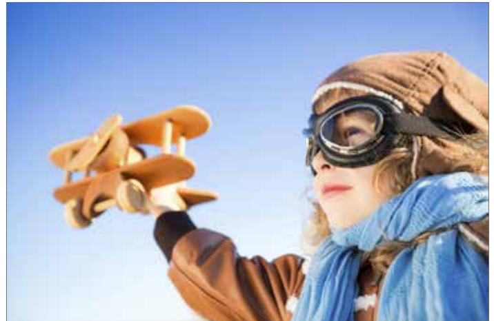
▲ De luchthaven viert dit jaar een memorabel jubileum. N-VA Wevelgem viert graag mee en klinkt op een prachtige toekomst.

Die toekomst zal zich ontwikkelen in een zo groot mogelijke harmonie met de omgeving. Met een ligging tussen de woonkernen van Wevelgem en Bissegem, zullen zowel het personeel van de luchthaven, de gebruikers als de omwonenden de vruchten plukken van overleg en samenwerking bij het ontwikkelen van nieuwe initiatieven.