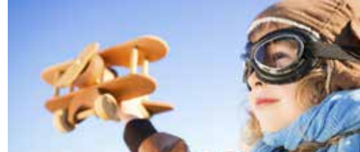
Luchthaven blaast honderd kaarsjes uit p.3