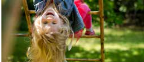
Deze zomer speelpleinwerking in Gullegem p.2