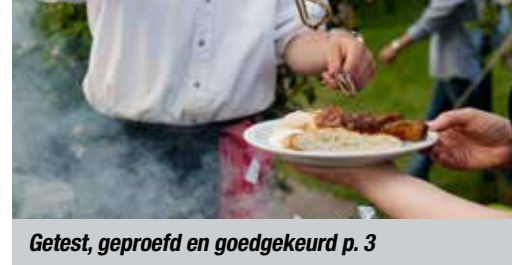
Getest, geproefd en goedgekeurd p. 3