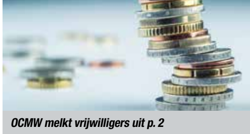
OCMW melkt vrijwilligers uit p. 2